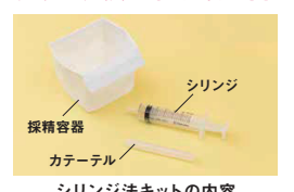
シリンジ法キットの内容